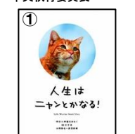
「人生はニャンとかなる！」 水野敬也/長沼直樹 著