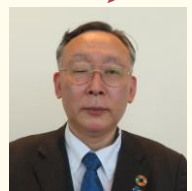
株 株式会社マツキヨココカラ & カンパニーで働く組合員の皆様、日々のお仕事お疲れ様です。

株 株式会社マツキヨココカラ & カンパニーで働く組合員の皆様、日々のお仕事お疲れ様です。新型コロナウイルス感染症対策の影響により、日々店舗でご苦勞されながら業務に取り組んでおられる皆様に敬意を表するとともに、心より感謝を申し上げます。マツキヨココカラ & カンパニー労働組合連合会（MC & C 労連）では、結成にあたり労連を知って頂くための企画を実施しています。第1弾では「労連を知って頂く」第2弾では「社長を知って頂く」第3弾では「委員長を知って頂く」を実施しました。更に6月に、第4弾として「労連を認知して頂く」企画を計画しています。たくさんの方の皆様の応募をお待ちしています。MC & C 労連が結成されてから、2021冬季一時金交渉を経て、2022労働条件闘争中（3月～4月）です。新型コロナウイルス感染症の収束が見えないなかで、働く仲間間の頑張りや、各社の労使交渉で、評価して頂いていると思っます。会社の成長が、働く人々の幸せの上にあることを願っています。